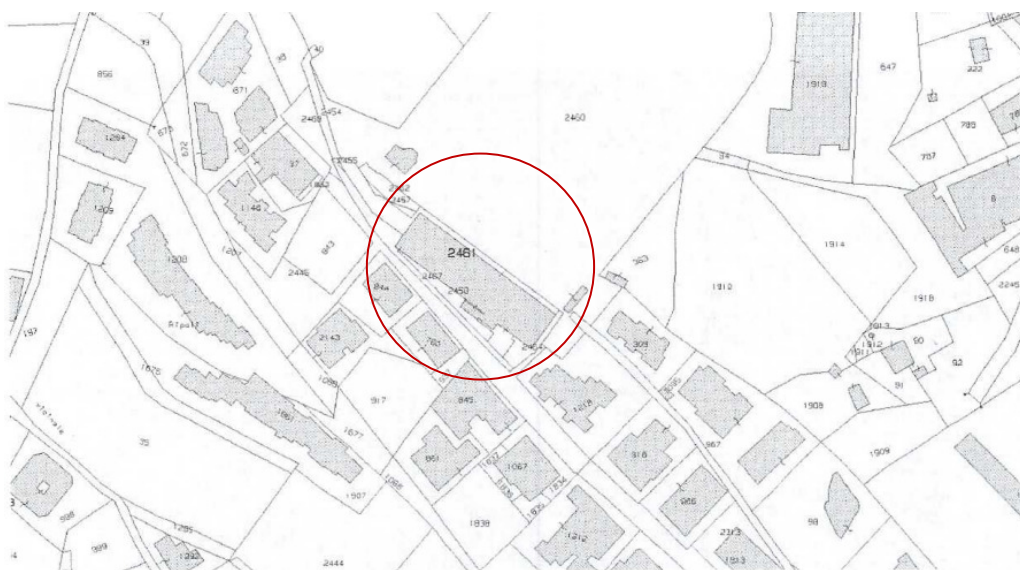
Stralcio foglio catastale 74 p.la 2461

Il bene in esame risulta essere rappresentato nello stralcio dell'estratto di mappa catastale in scala originale 1:2000, Sezione Censuaria Tivoli, Foglio 74, Mappale n.° 2461: