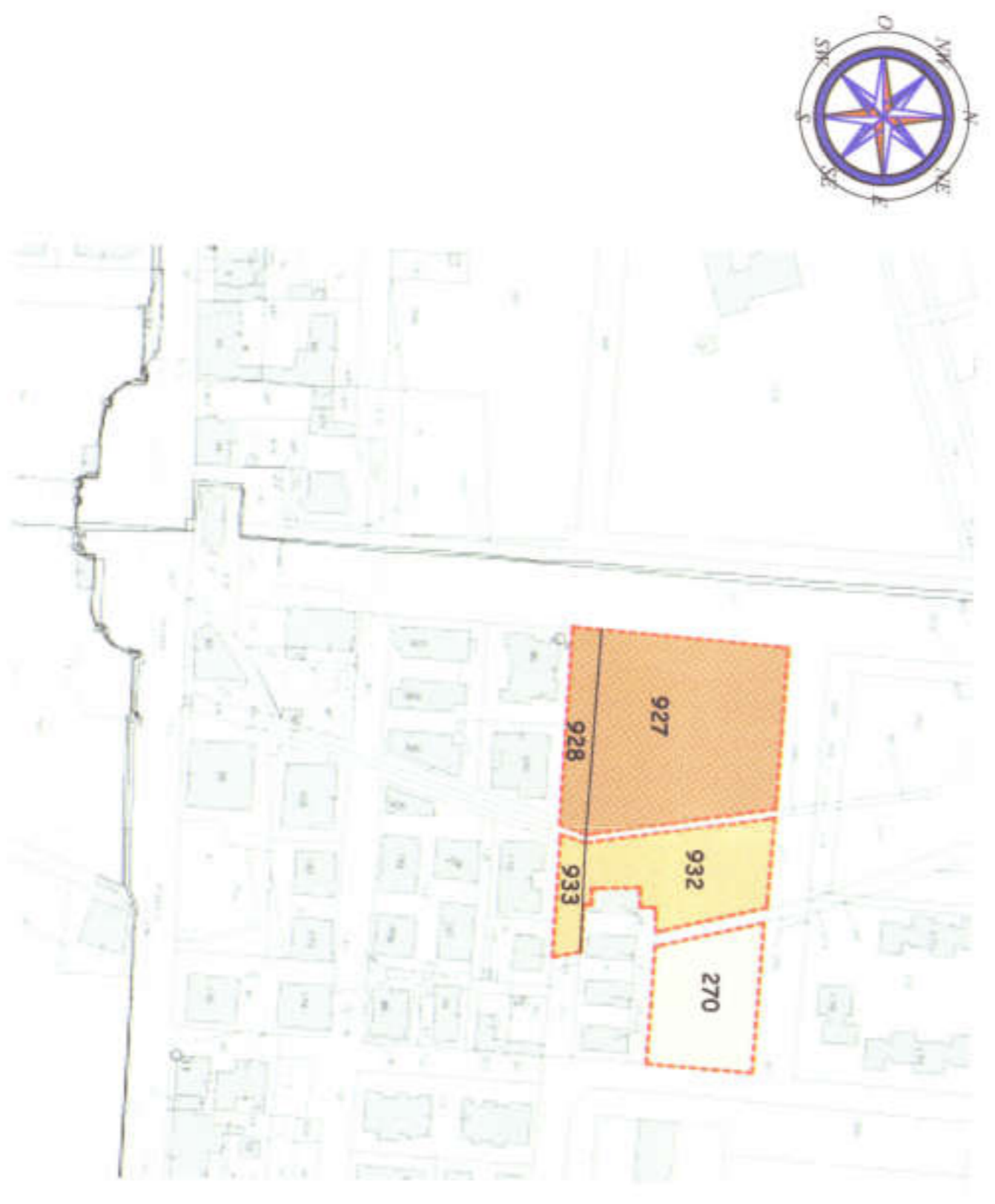
STRALCIO CATASTALE CON INDIVIDUAZIONE DELLA PROPRIETA' E DEL PERIMETRO DEL PDL - FOGLIO N° 50 - PART. ILE N° 927, 928, 932, 933, 270 scala 1:2000