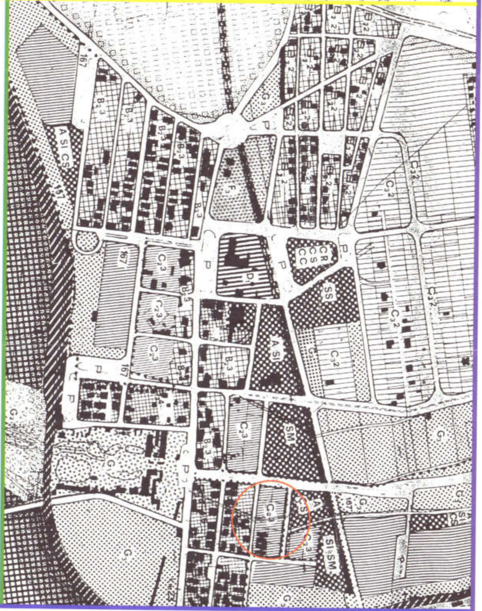
STRALCIO DI PRG - scala 1:5000